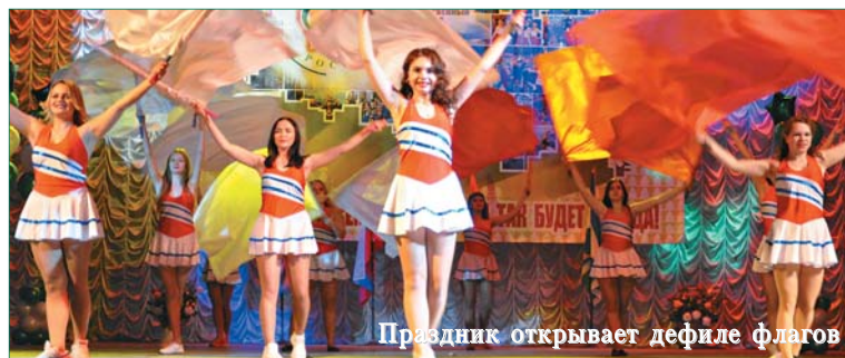
Праздник открывает дефиле флагов