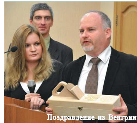
Поздравление из Венгрии

Звания «Почетный работник высшего профессионального образования