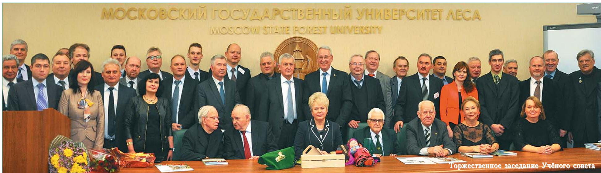
Торжественное заседание Ученого совета