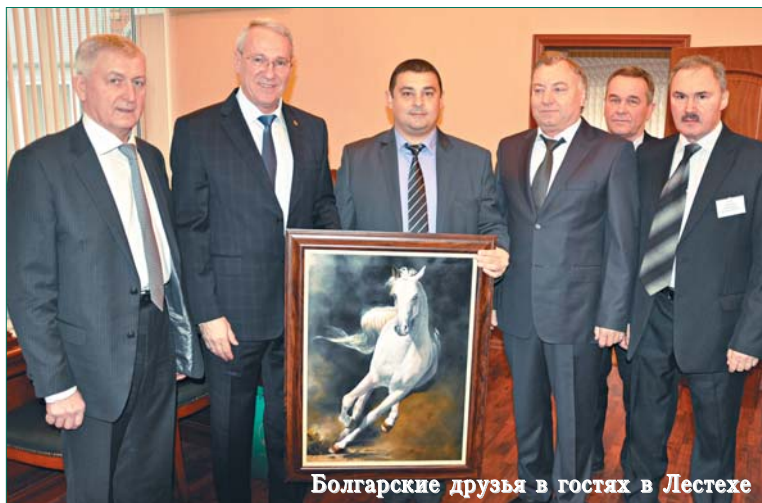
Болгарские друзья в гостях в Лестехе